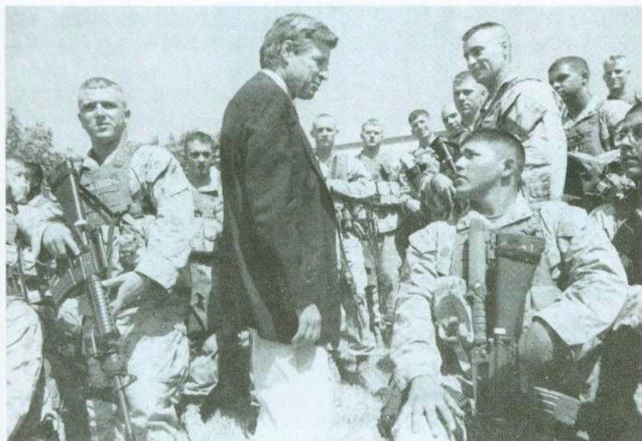
في أثناء استقبال رئيس الوزراء طوني بلير في البصرة